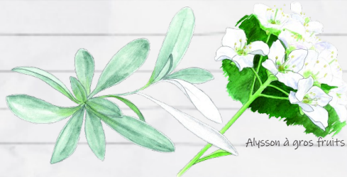
Alysson à gros fruits

Emprunter le GR®651 jusqu'à Marcilhac-sur-Célé.